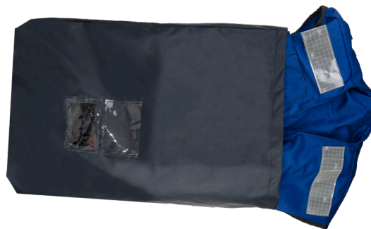
BORSA DI TRASPORTO

Nastri rifrangenti posti sul gilet per aumentare la visibilità dell'utilizzatore.